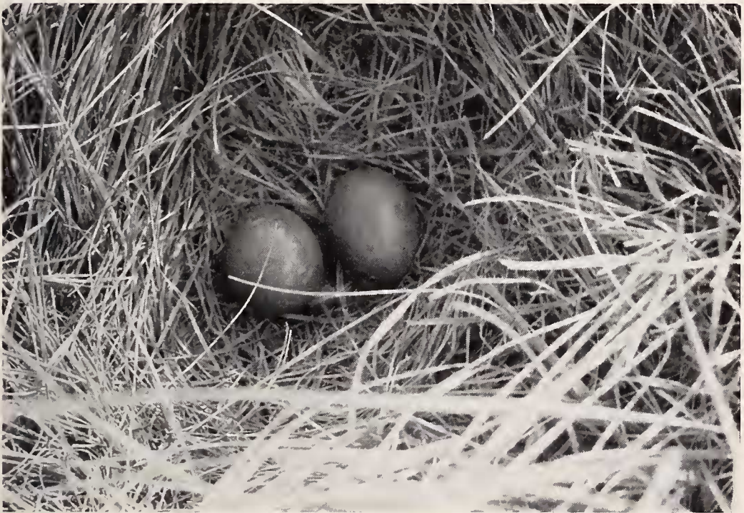
Abb. 4: Gelege.